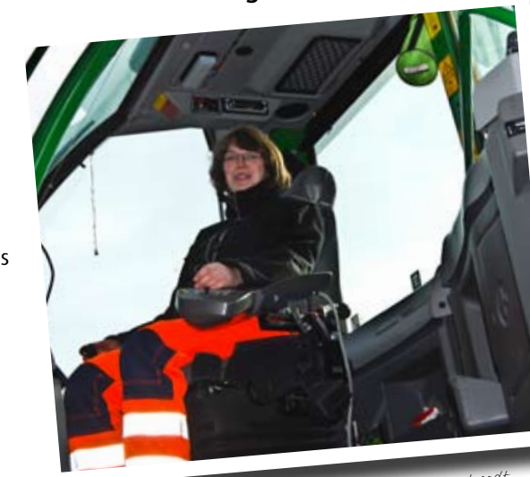
Her i førerhytta på skogsmaskinen trives jeg svært godt.