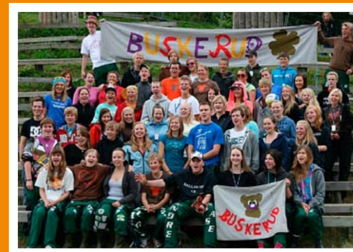
4H-ere fra Buskerud på nordisk leir sommeren 2009.

I Numedal er det flere 4H-klubber fra Vittingen 4H i sør til Dagali 4H i nord. Ta en titt på www.4h.no/buskerud for å se hvor din nærmeste klubb er. Der finner du også mer informasjon om 4H og aktivitetene våre. Ta kontakt med din nærmeste klubb dersom du har lyst til å bli med i 4H!