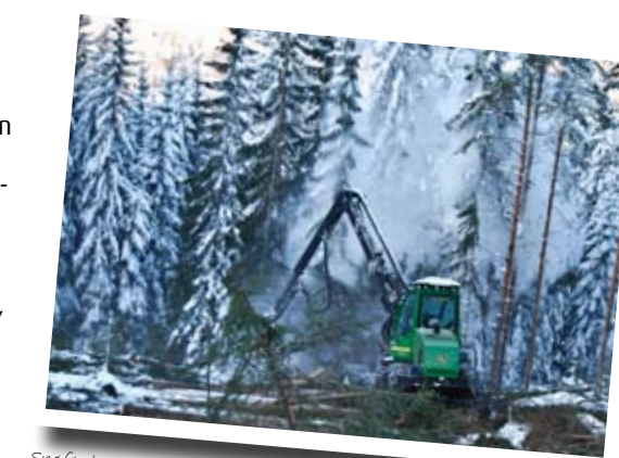
Sneføyka står når Linn-Merete legger ned trærne i vestfoldskogene.