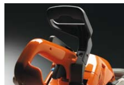
TrioBrake™-sperren hjelper deg å utføre arbeidet mer effektivt, uten å forstyrre dine normale håndbevegelser når du arbeider ergonomisk riktig.

Copyright © 2010 Husqvarna AB (publ). All rights reserved. Husqvarna and other product and feature marks are trademarks of Husqvarna AB (publ).